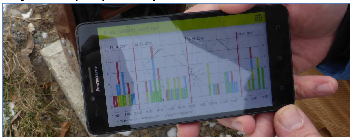
Fotografie č. 2 – pracovník nadace ing. Luboš Kala ukazuje výsledky třídní variace